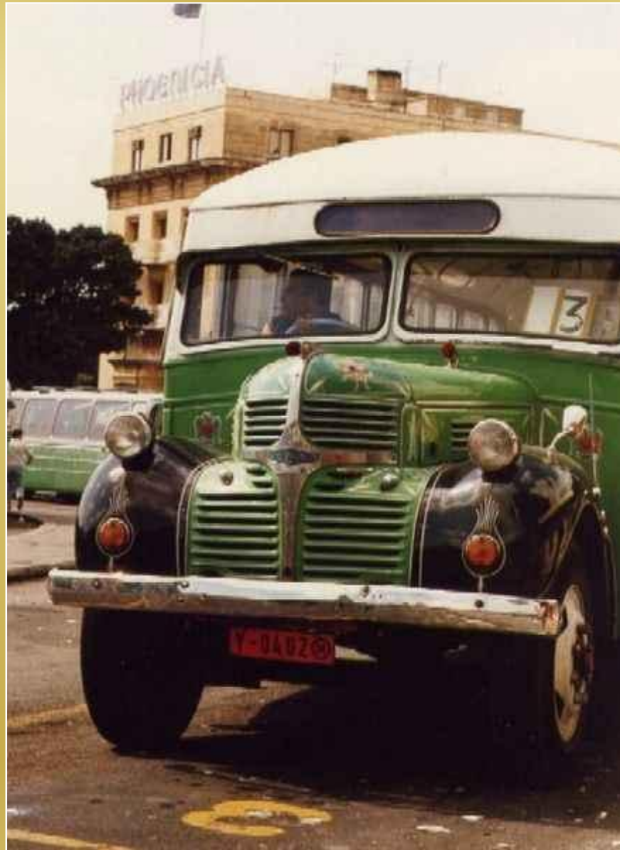
Sary malta ski autobus