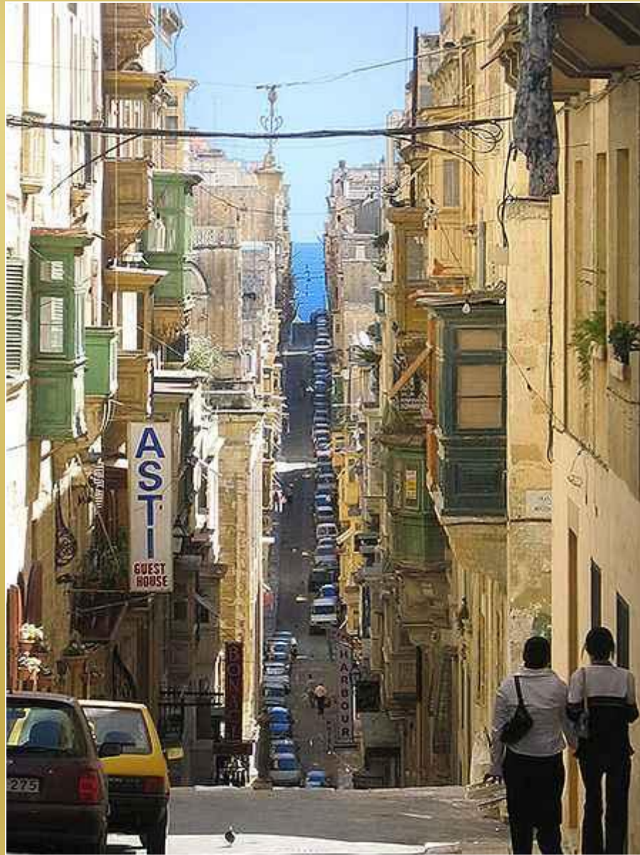
Valletta - Ulica w. Urszuli