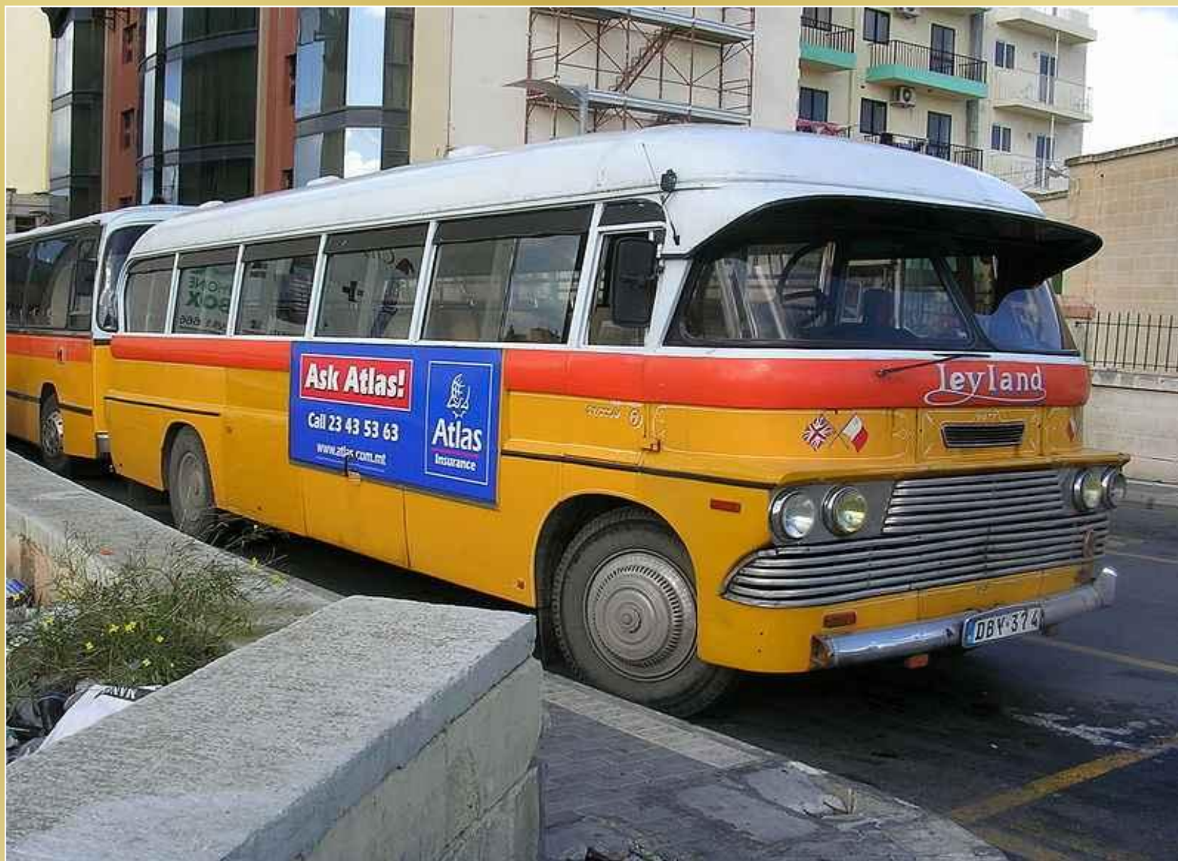
Autobus na Malcie