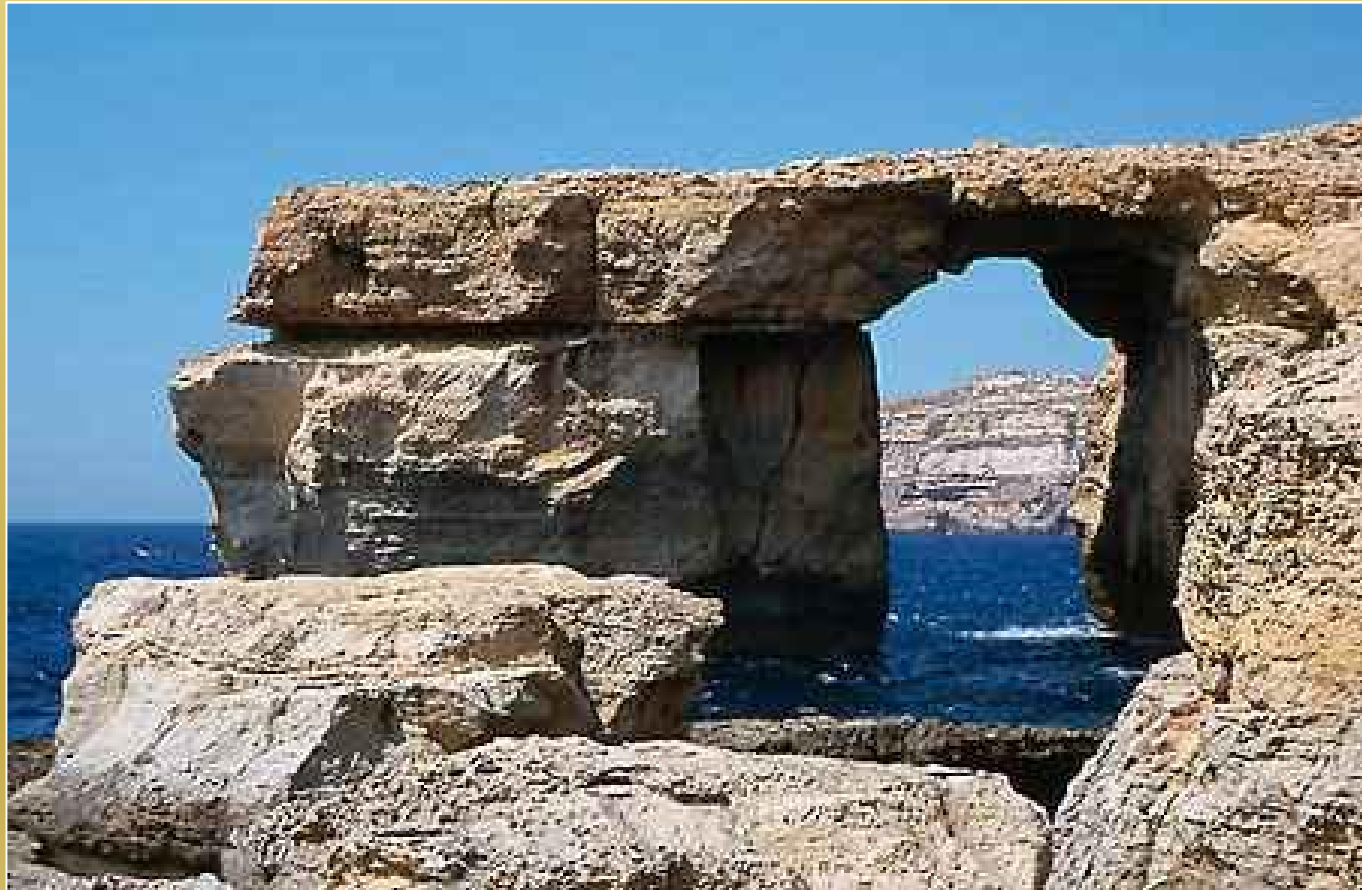
Lazurowe okno w Dwejra