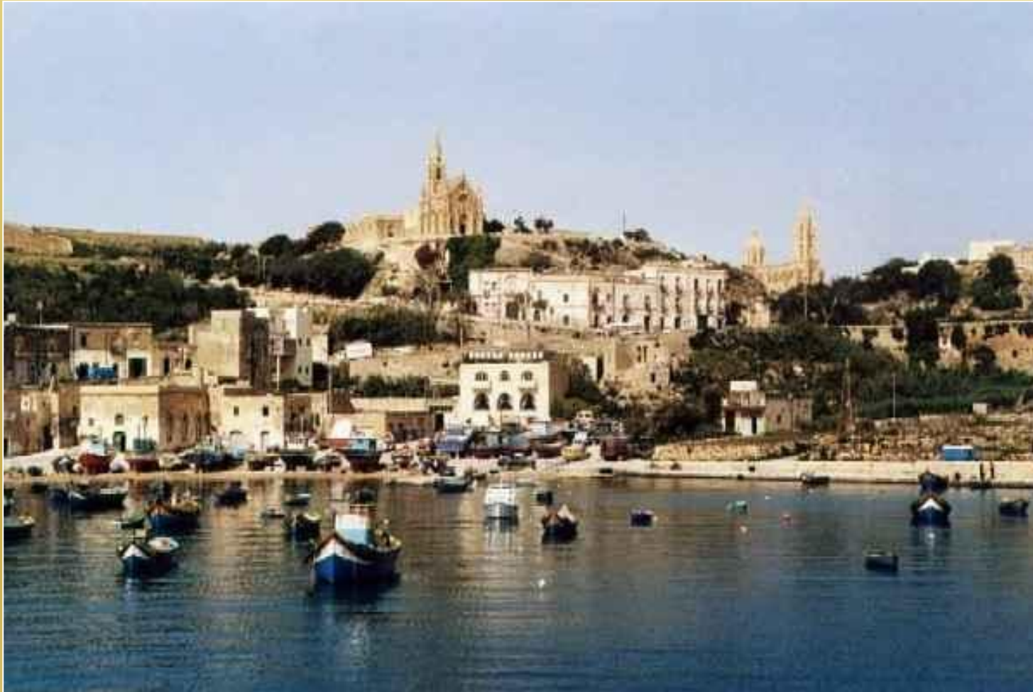
Miasto M arr