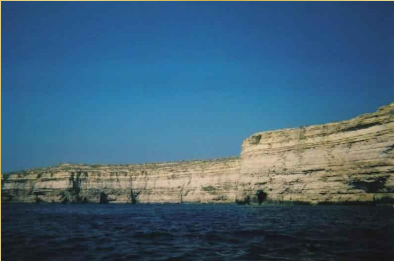
Klify na Gozo