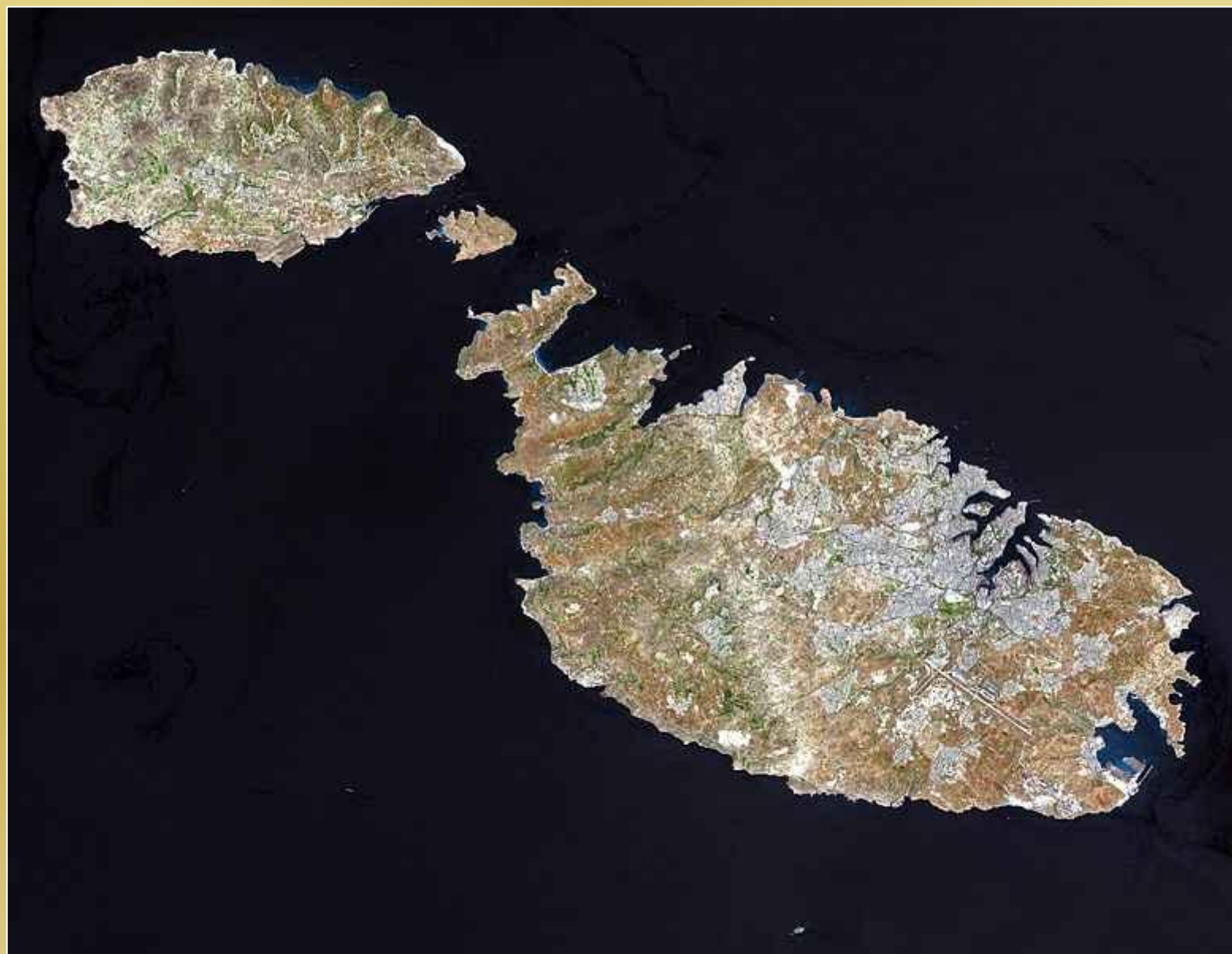
Satelitarne zdj cie Malty