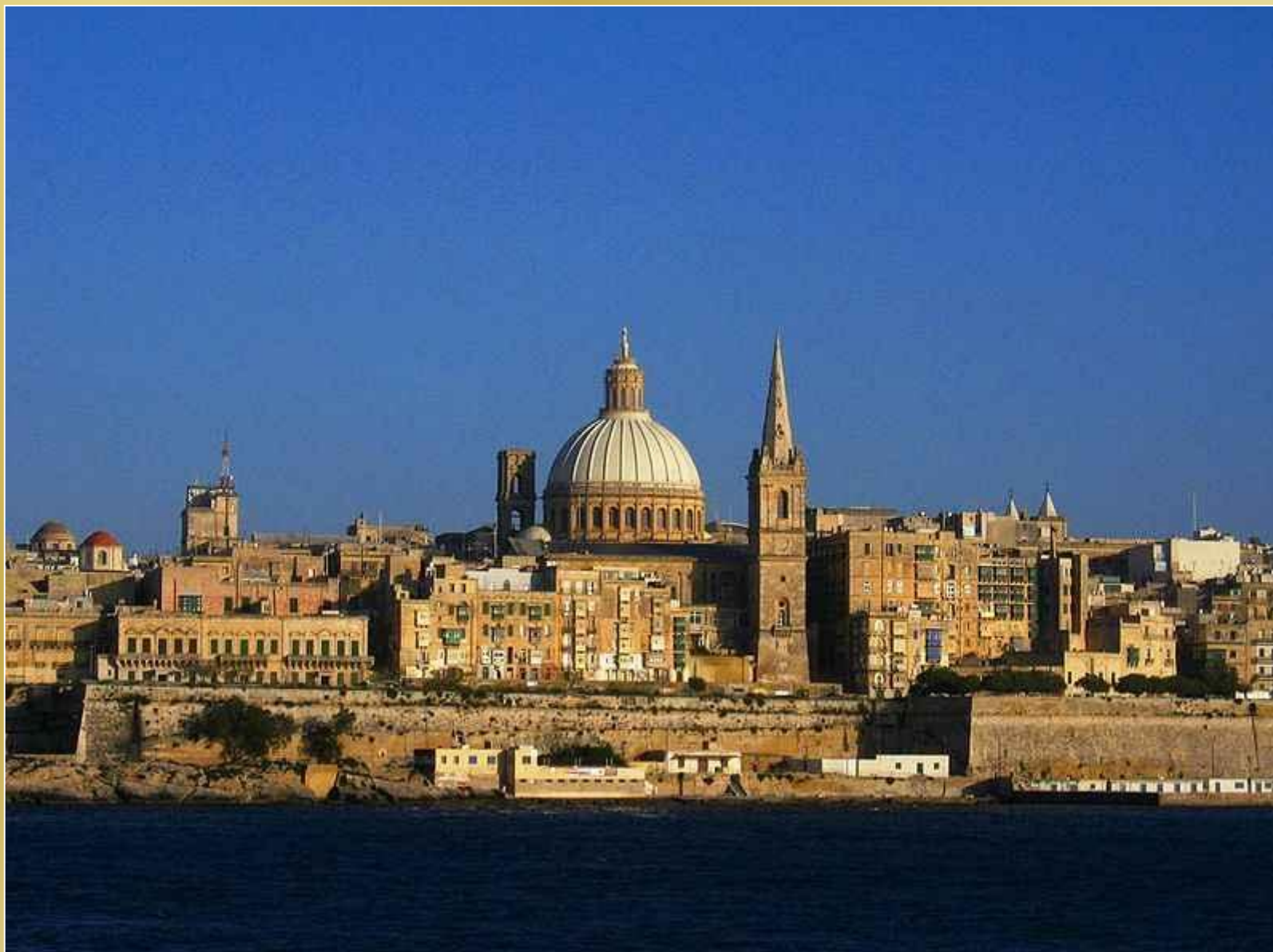
Panorama Valletty (widok od strony Zatoki Marsamxett)