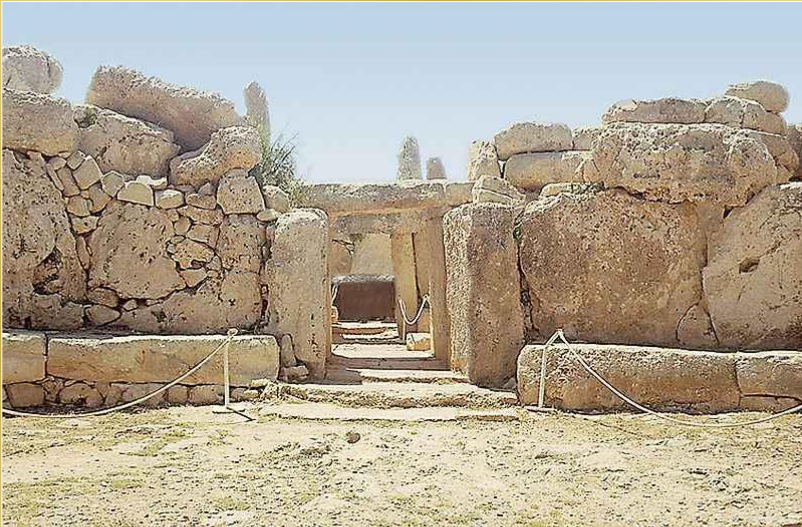
wi tynia Mnajdra