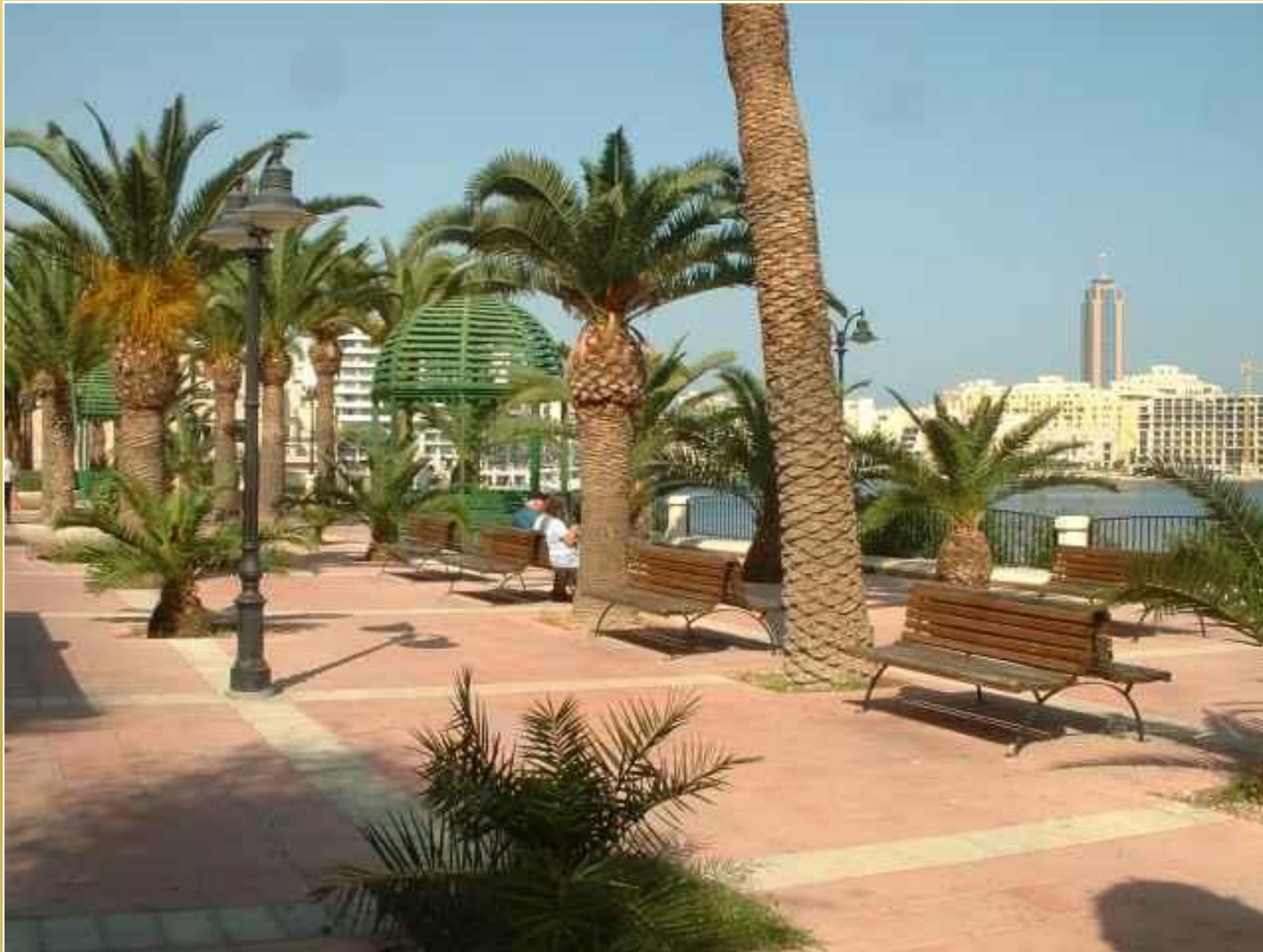
Nadbrze na promenada w Sliemie