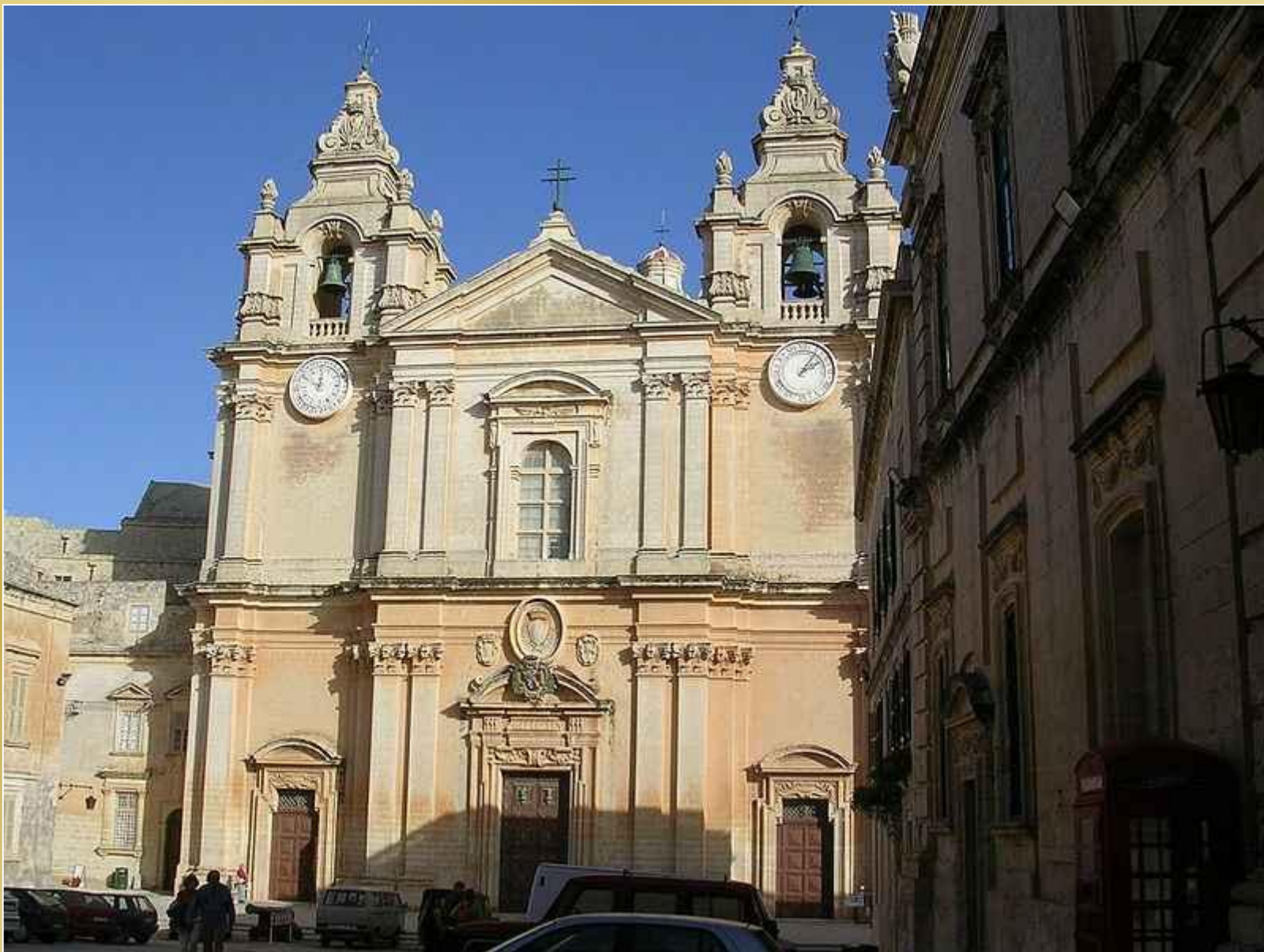
Katedra w Mdinie