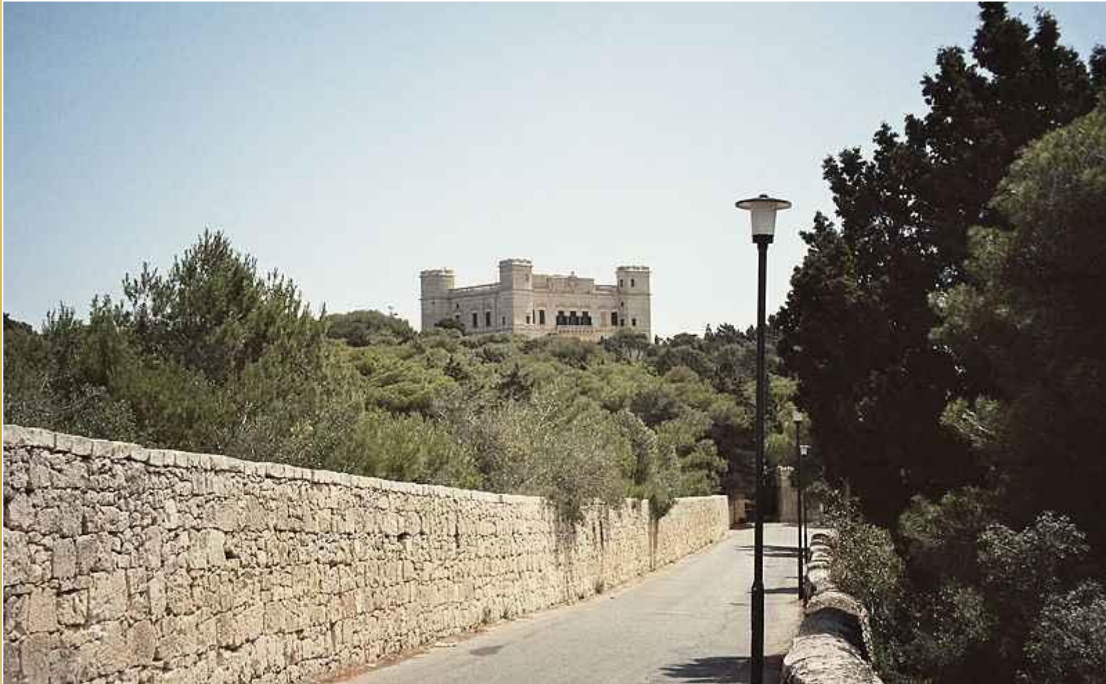
Buskett Gardens przy Verdala Palace