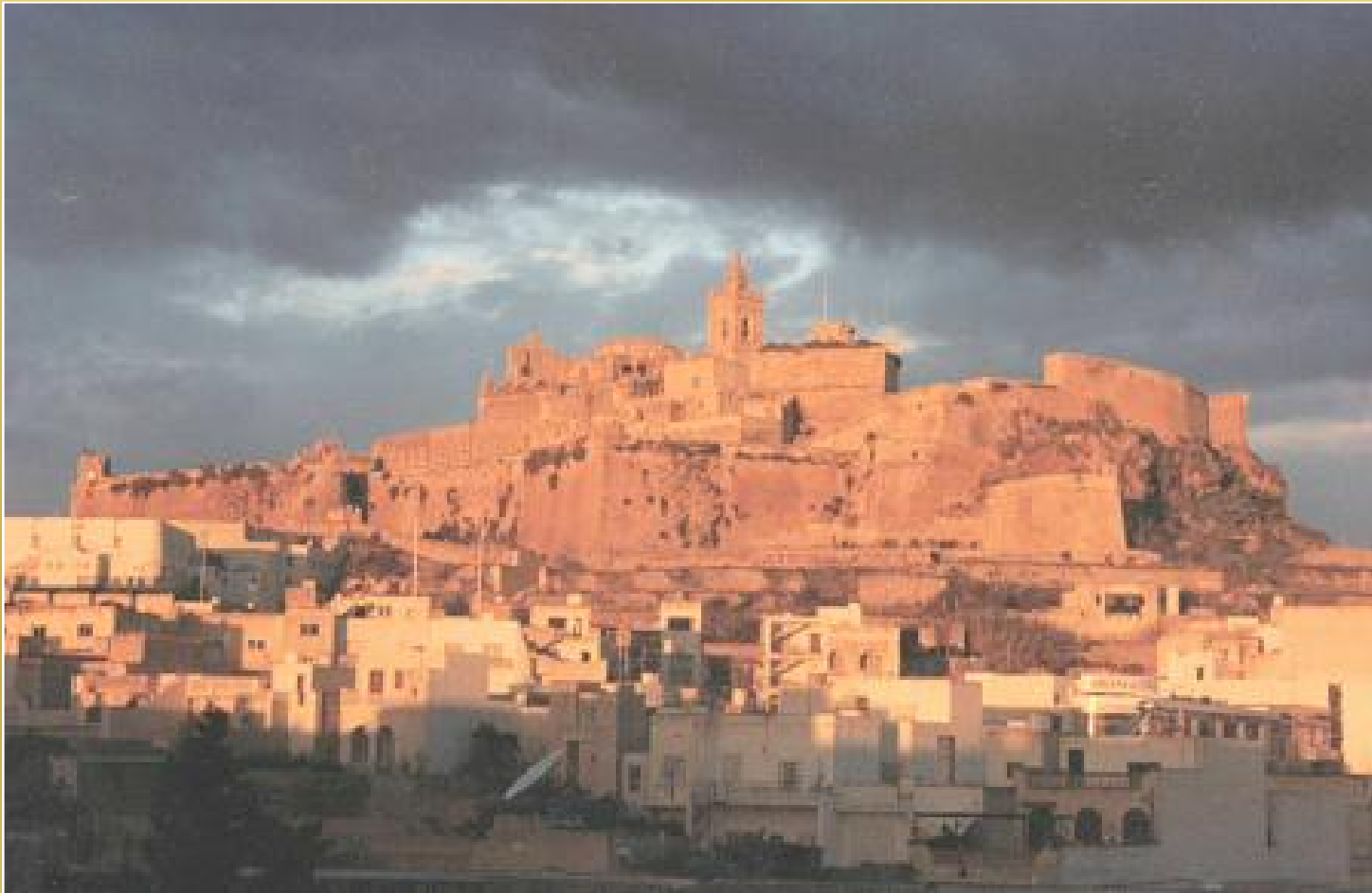
Cytadela w Victorii