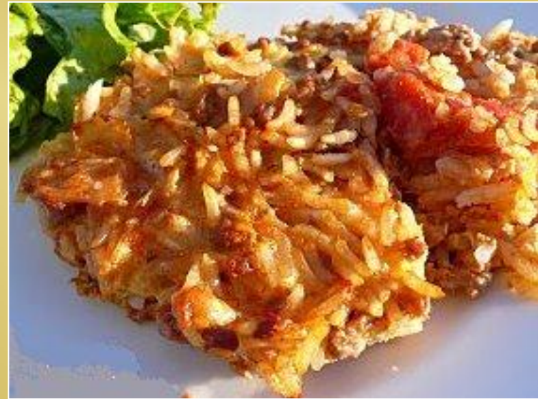
Ross Fil Forn