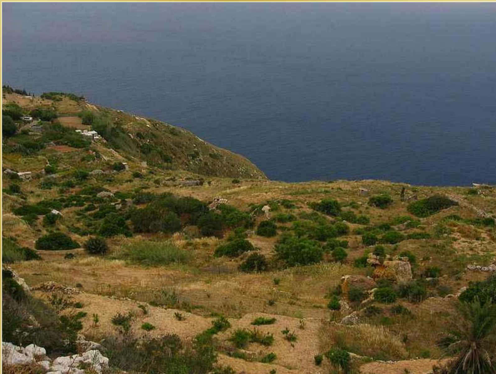
Widok na Morze ródziemne z klifu Dingli, (L-Irdum ta 'nie-Dingli)