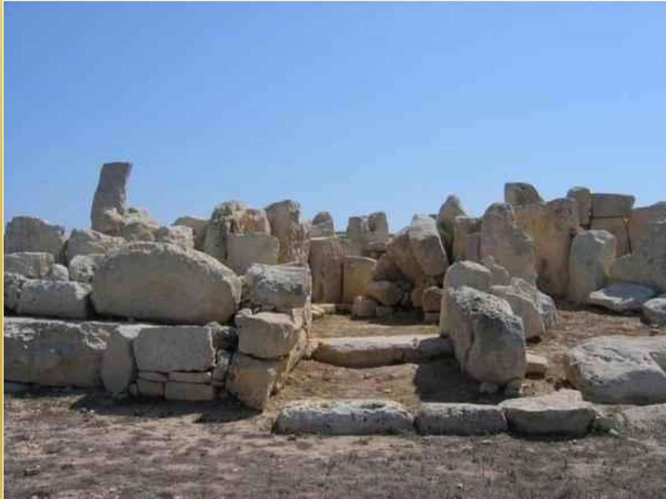
a ar Qim