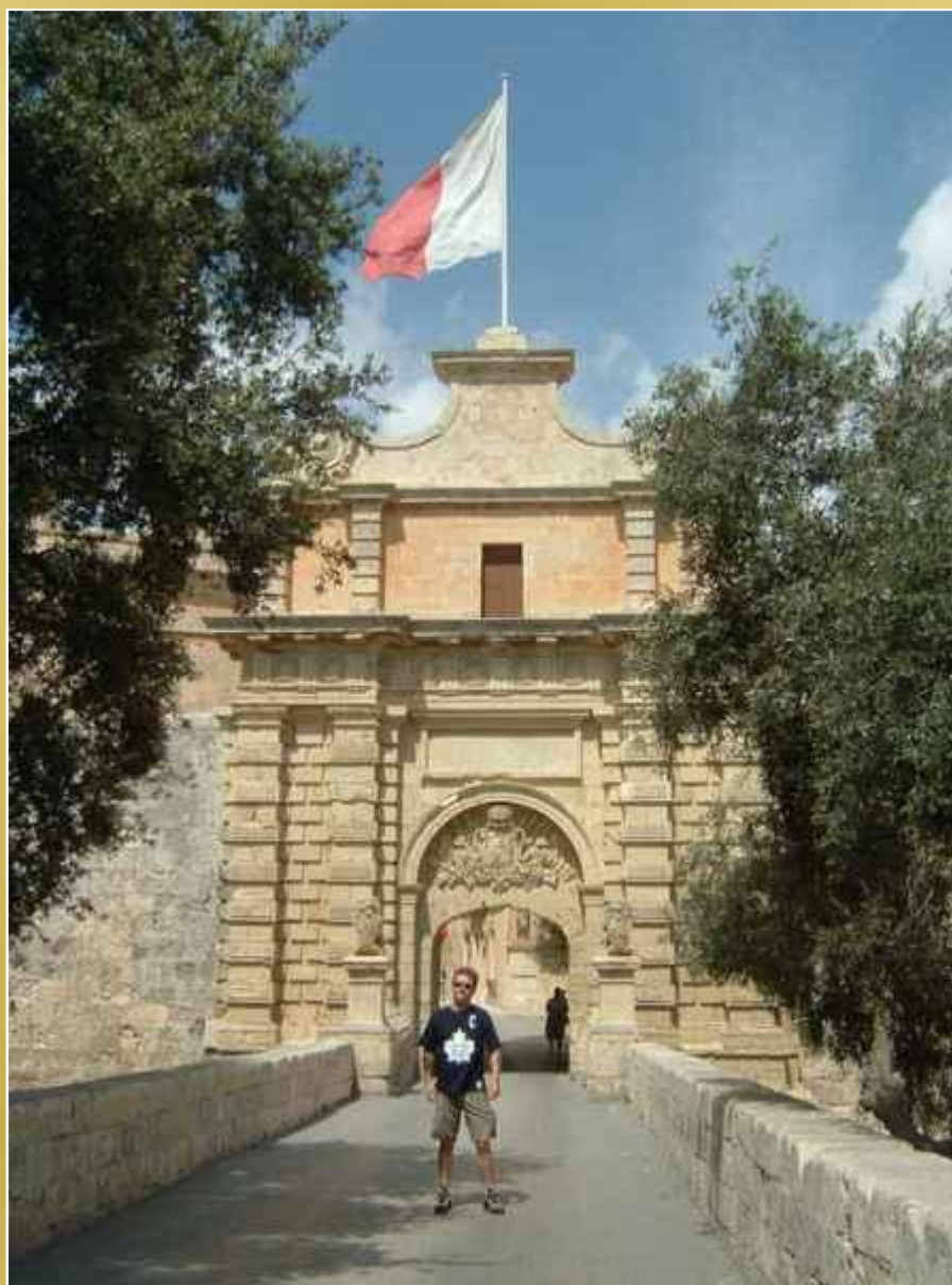
Brama g ówna w Mdinie