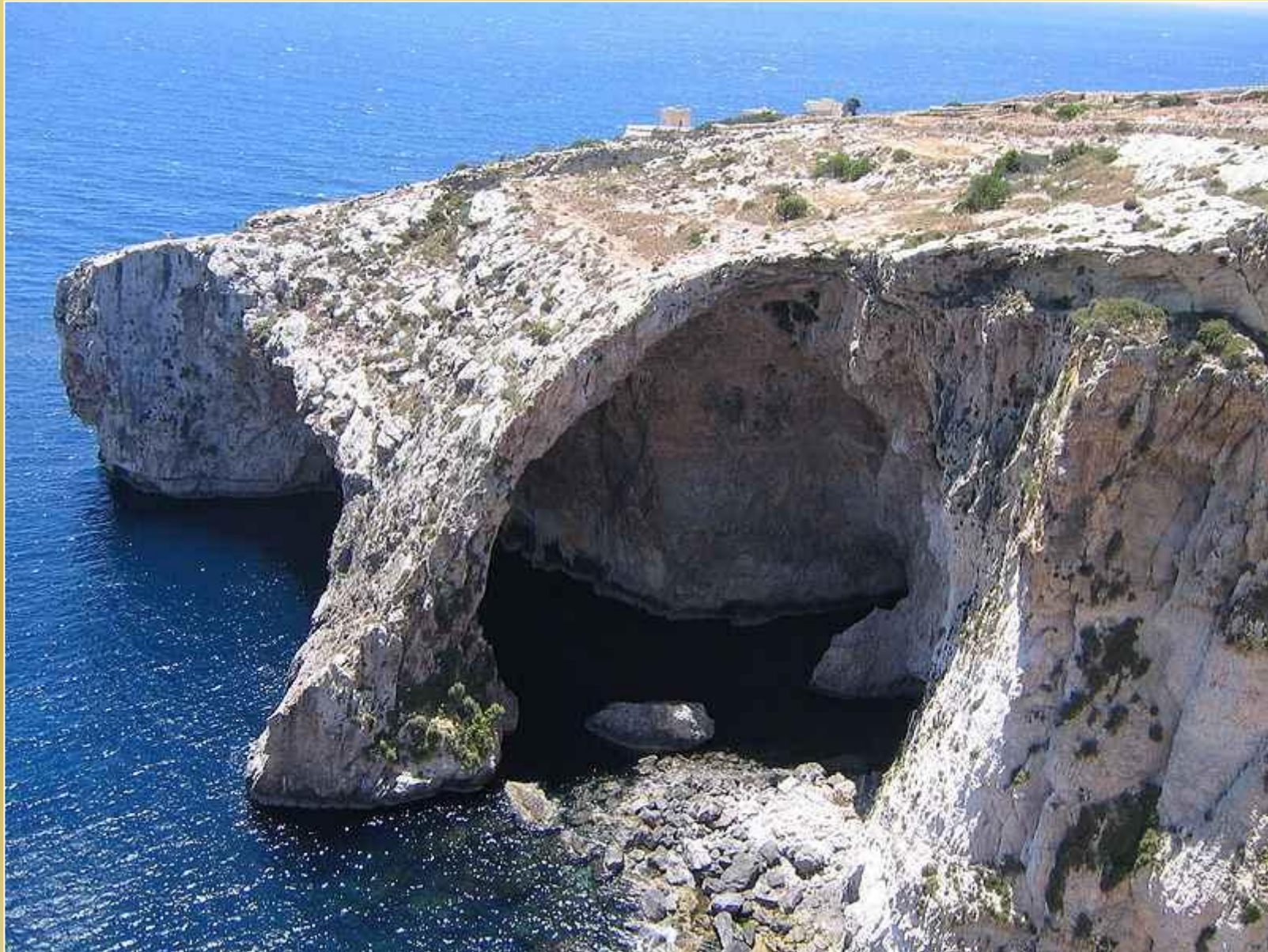
urrieq - Bû kitna Grotta