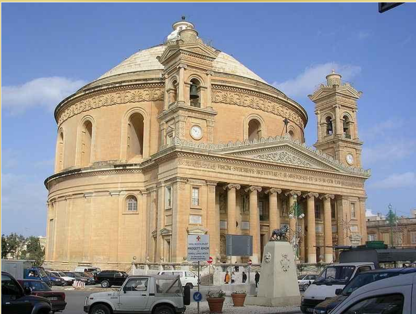
Rotunda w Mosta